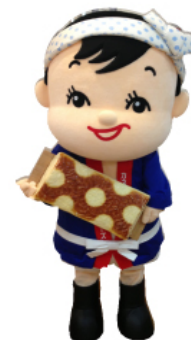
▲カネテツデリカフーズの キャラクター「てっちゃん」