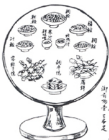
▲文献に初めて登場するかまぼこ 1115 年(永久 3 年)の祝膳の一部 全国かまぼこ連合会 HP より 引用:「かまぼこの歴史」(清水亘著) 日本食糧新聞社