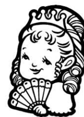
イメージキャラクター 「マリー・アントワ・てっちゃん」