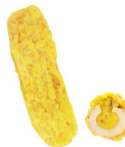
パンプキンサラダちくわ

ちくわに明太子とじゃがいも のポテトサラダをはさんで揚 げました。 (通常価格) 1本 350円