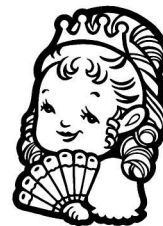
イメージキャラクター 「マリー・アントワ・てっちゃん」