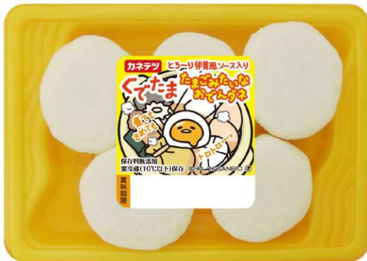
<ラベルデザイン 2パターン展開>

パッケージには、商品オリジナルのイラストと、ぐでたまの一言入りで2種のデザインを展開。ぐでたまをイメージした黄色のトレーを使用し、売場でもぐでたまの世界を演出いたします。